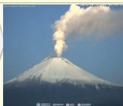
Imagen destacada de las últimas 24 horas

CON LA PARTICIPACIÓN DEL INSTITUTO DE GEOFÍSICA DE LA UNAM